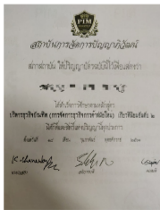
正大管理学院学士毕业证书